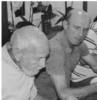
... mit leckerm und gemütlichem Abschluss...