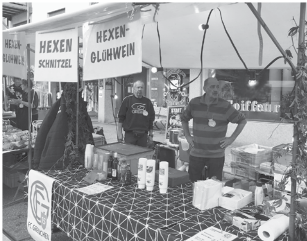
Warten auf den Ansturm, ob als Gäste oder als Helfer.

Ein wunderschöner Anlass sowohl visuell wie auch gesellschaftlich. Jedes Jahr trifft man Bekannte, die Wurzeln in Grenchen haben, aber von auswärts zu Besuch kommen.