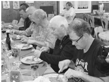
Fussballer sind doch auch Genussmenschen, oder nicht?