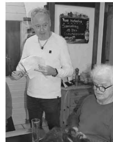
Glückwünsche zum kommenden Turnier durch Präsident Aschi