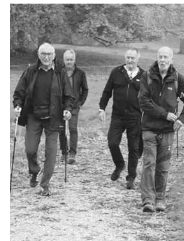
Unterwegs auf Schusters Rappen oder gespannt am Tisch – ernste, aber zufriedene Gesichter.

Der Bözingenberg, 930 Meter über Meer war diesmal Ausgangspunkt und Ziel zugleich. Der rund eine Stunde dauernde Rundgang ohne grosse Höhenunterschiede passt ausgezeichnet für die zu einem grossen Teil havarierten Gelenke der Teilnehmenden. Beim Kredo der Senioren- und Veteranen-Bewegung steht ja sowieso der Plausch als Mittelpunkt, und der beginnt spätestens mit dem Apéro. Man freut sich über das Wiedersehen ehemaliger Mitspielern und ihren charmanten Begleiterinnen, frischt die Anekdoten auf und schwärmt von längst vergangenen Zeiten. Durch soviel Austausch und Spekulationen hinsichtlich WM kommt auch eine gesunder Appetit auf und man freut sich auf eine wunderbares Essen. Der gelungene und wiederum durch J. P. Aschwanden und Team perfekt organisierter Anlass dauerte gefühlt wieder zu kurz. Allzu schnell heisst's: «Bis zum nächsten Mal».